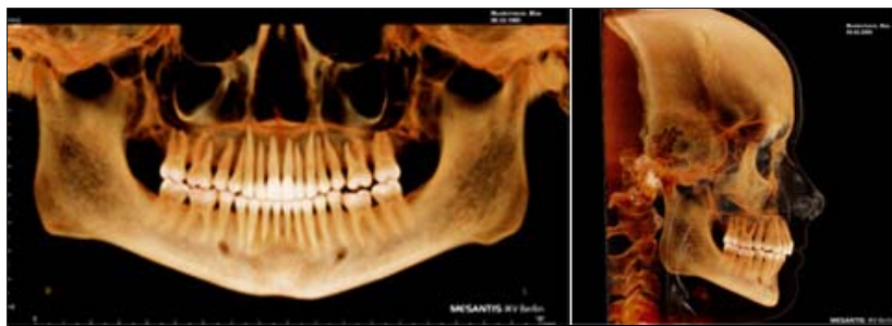
Abb. 3: Panoramaansicht, die aus einem DVT generiert wurde. Aufgrund der Patientendaten (oben rechts) darf diese Aufnahme datenschutzrechtlich nicht per E-Mail unverschlüsselt versendet werden. Abb. 4: Typische Darstellung des Schädels von lateral mit Überlagerung der oberen Atemwege. Aufgrund der sogenannten „Clipping-Funktion“ (Darstellung dünnster Schichten ohne Überlagerungen) können Messpunkte für 2-D- bzw. 3-D-Analysen viel genauer bestimmt werden als bei herkömmlichen Fernröntgenaufnahmen. Auch diese Aufnahme darf nicht unverschlüsselt versendet werden.

Bei der Übersendung der Röntgenbilder via Internet müssen die involvierten Ärzte neben den Anforderungen an die ärztliche Schweigepflicht auch datenschutzrechtliche Bestimmungen beachten. Grundsätzlich sind (Zahn-)Ärzte in Fällen der Mit- und Nachbehandlung gegenüber den involvierten Ärzten von der ärztlichen Schweigepflicht befreit. Denn hier ist regelmäßig eine stillschweigende Einwilligung des Patienten anzunehmen.